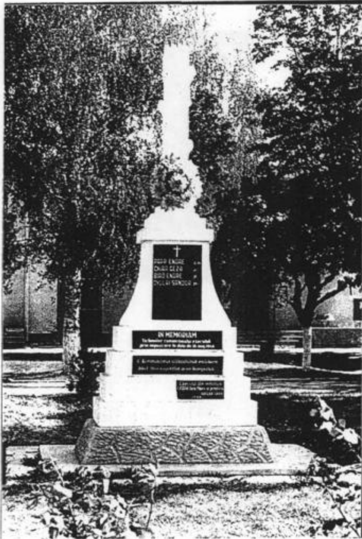
MONUMENTUL DE LA ODOREU

Când Bihorul era în flăcări suferințele țărănești s-au transformat în răscoplă, în comuna comună situată la 5 km. de Satu Mare.