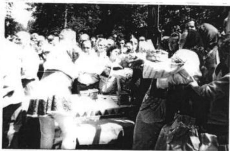
TĂRANII LE CINSTESC MEMORIA