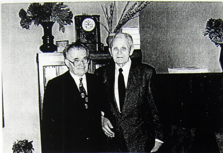
Cu Corneliu Coposu după reînscrierea PNT-CD ca primul partid 11 Ianuarie 1990