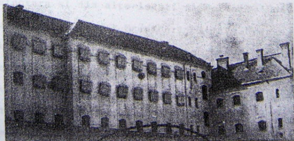
COLT DIN INTERIORUL INCHISORII VĂCĂREȘTI