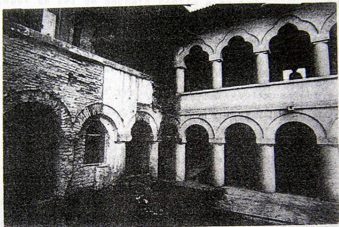
Chiliile Mănăstirii Văcărești transformate în celule fotografiate în timpul demolării acestui monument istoric, și ca arhitectură și ca suferință românească.