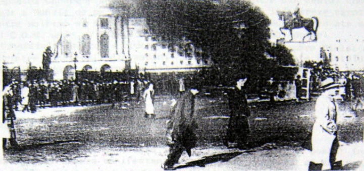
VICTIME: Imuscati de comunisti din Minister