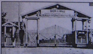
Târgu Jiu: l'un des nombreux camps où étaient enfermés les opposants au régime.