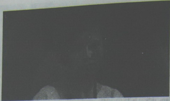
Wied Buna Eleonora