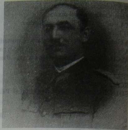
Gen. Zorzor Vasile