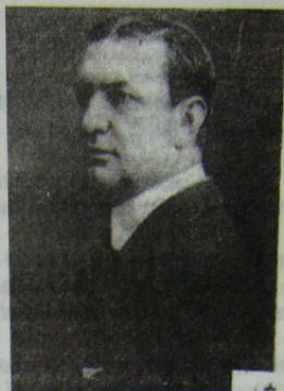
Constantin Argetoianu in 1921