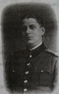
gen. Stavrescu Gh.